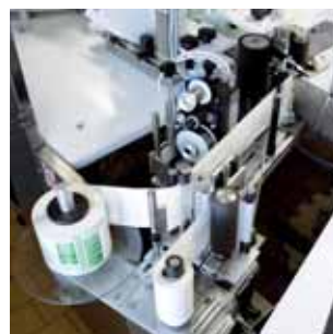
1 Etichettatrice Labeller