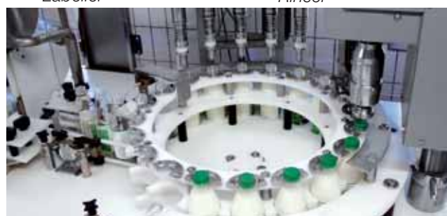
3 Riempitrice Filler